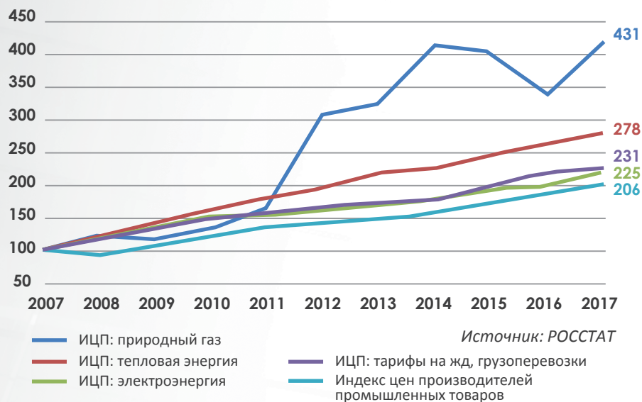
Динамика цен на товары и услуги естественных монополий в сравнении с ценами промышленности, %

Тарифы на электроэнергию для промышленных потребителей выросли в 2017 г. по сравнению с 2007 г. в 2,25 раза, на грузовые ж/д перевозки – в 2,31 раза, на тепловую энергию – в 2,78 раза, на газ – в 4,31 раза. При этом цены производителей выросли не так существенно – всего в 2,06 раза.