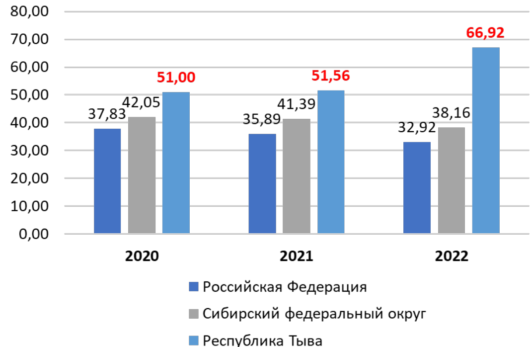
Доля преступлений, совершенных в состоянии алкогольного опьянения, проценты**

** По данным ЕМИСС, статистика МВД России ( https://fedstat.ru/indicator/36206 )