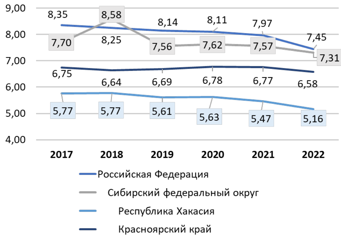
Доля инвалидов в численности постоянного населения, %