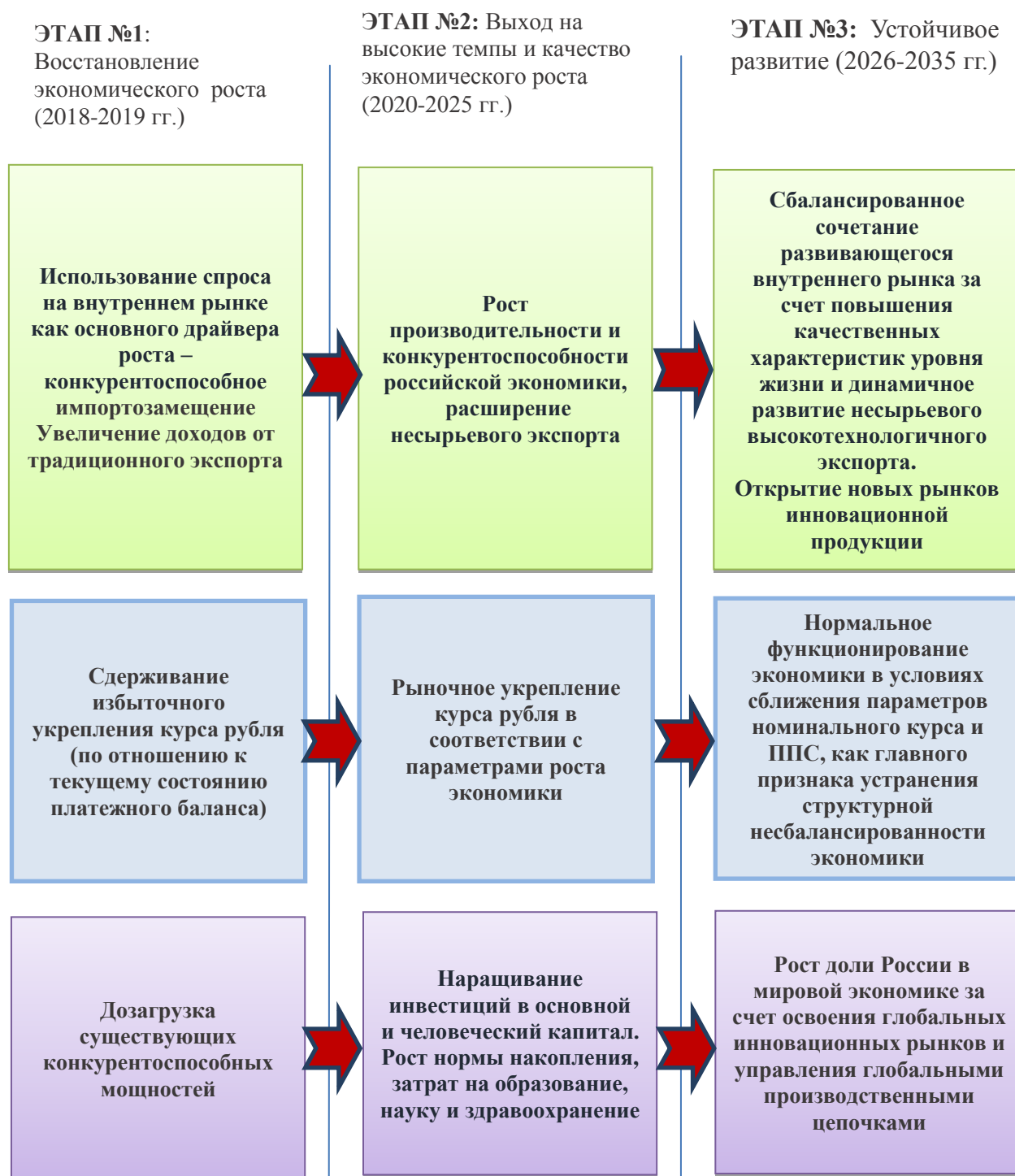
Рис. 2 Эшелонирование факторов роста экономики

Рассматривая ключевые альтернативы экономического развития, следует исходить из того, что каждой из них должна соответствовать определенная экономическая политика, предполагающая перераспределение имеющихся ресурсов и набор конкретных мероприятий.